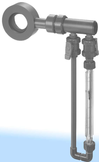
Рисунок 1 Диафрагменный расходомер F O N4